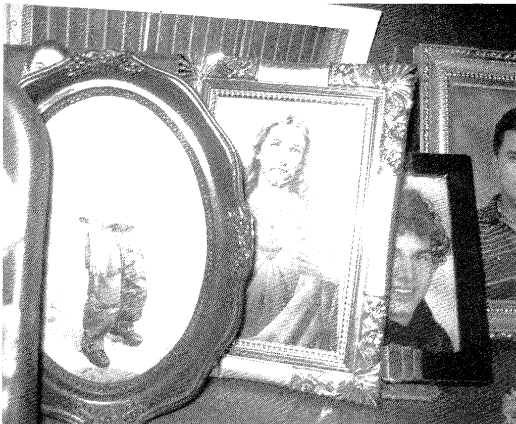
Familiebilleder i ecuadoriansk hjem.

Vi kommer ikke ind i et fællesskab for at opleve noget. Vi træder ind ad døren til et fællesskab for at lære noget nyt, for at blive anderledes, mere kærlige, dydige og retfærdige. Et "Samfund" er ikke en oplevelseskategori, men en læringskategori , hvor formålet er, at vi skal opdrages, forbedres eller udvikles. Det er f.eks. også derfor, at ægteskabet, som er et "Samfund", er blevet indstiftet af Gud i Paradiset. Ægteskabet er ikke blevet indstiftet for, at vi skal kunne opleve ægtefællens søde følelser, men for at vi skal opdrages, forandre os og lære